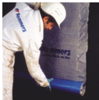
Den færdige bitumen vandtætningsmembran kan efter behov beskyttes med særlige dræningsmåtter før jordopfyldning.