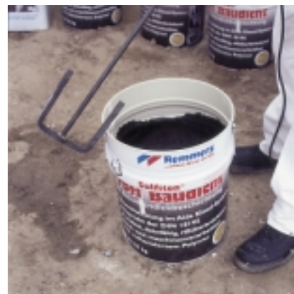
Ibland komponent B i komponent A i metalspanden.