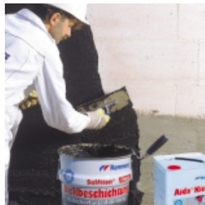
Suliton® ProfiTæt påføres i 2 lag med totalforbrug på 4 kg/m 2 ved normal jordfugt, eller op til 5,5 kg/m 2 ved højere vandtryk.